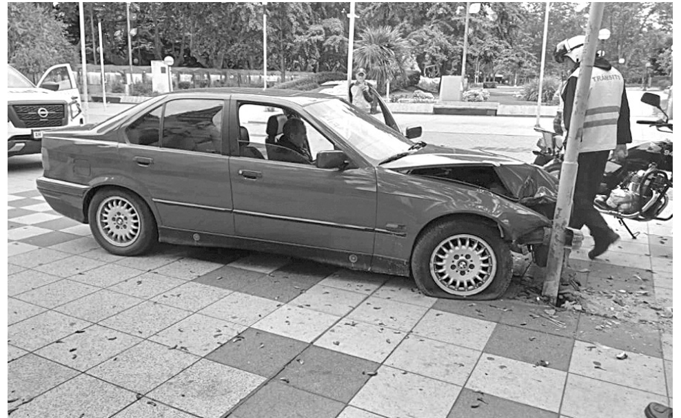
El BMW embistió una columna de alumbrado frente a la Catedral.

De inmediato se hizo presente en el lugar personal de la Dirección Municipal de Tránsito que, por protocolo, realizó el control de alcoholemia, el cual fue definitivamente positivo: estaba con 1,97 mililitros por lo que se labraron las