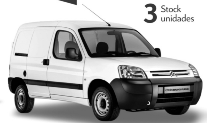
CITROËN BERLINGO FURGON 1.6 BUSINESS

HORARIO SÁBADO > AV. JUAN B. JUSTO 402 Y AV. CONSTITUCIÓN 7656, MAR DEL PLATA: DE 9 A 13 HS.