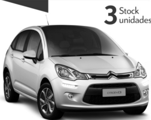
CITROËN C3 1.6 VTI 115 FEEL AM18