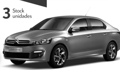
CITROËN C-ELYSEE HDI 1.6 FEEL AM18