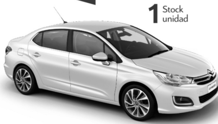
CITROËN C4 LOUNGE 1.6 VTI 115 LIVE AM19